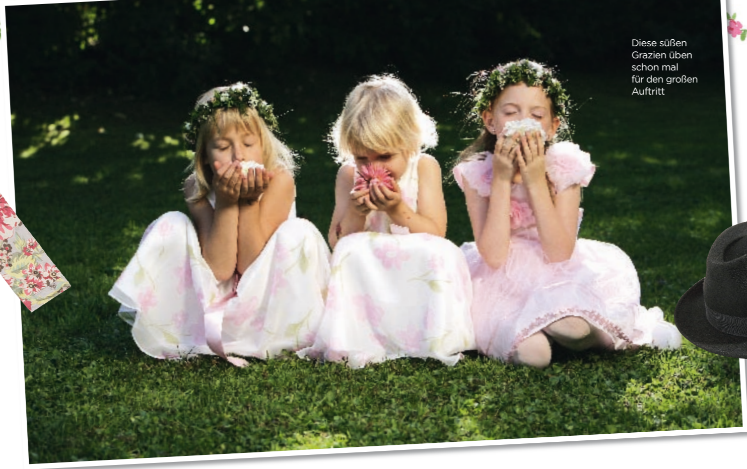
Diese süßen Grazien üben schon mal für den großen Auftritt