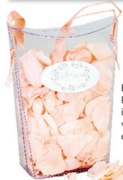
Echte Rosenblätter im 15-g-Beutel von In Due, ca. 4 Euro